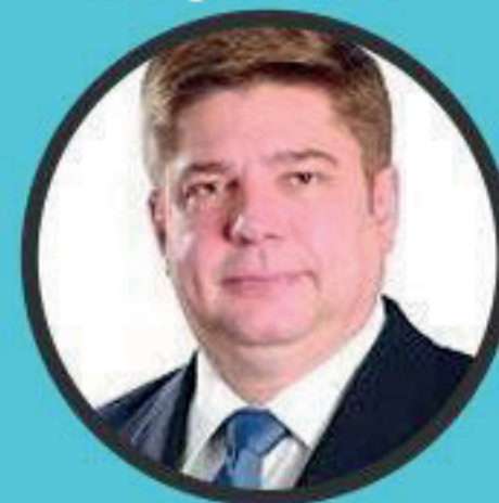
Raul Araújo Filho Ministro do Superior Tribunal de Justiça e Ministro do Tribunal Superior Eleitoral.