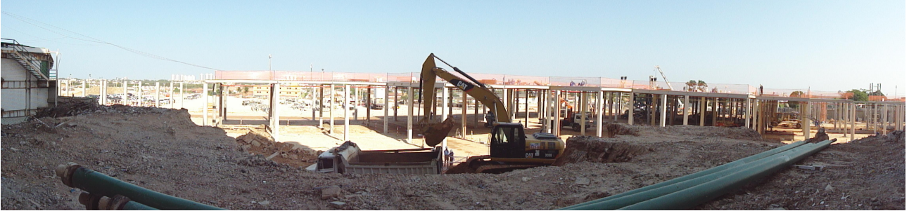
2ª ETAPA - Vista da área correspondente ao Estacionamento Coberto 2