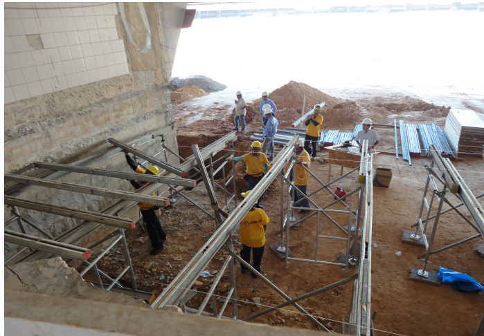
4ª ETAPA – Execução de laje inclinada na área de banheiros / boxes do estádio.