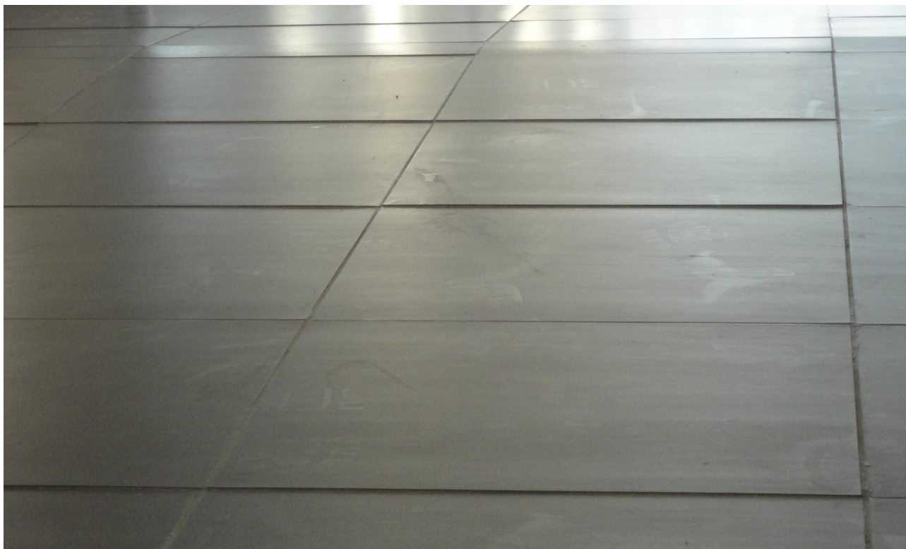
Baixa qualidade no assentamento do Porcelanato do piso da SESPORTE.