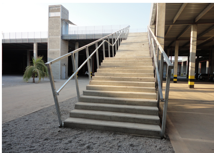
Corrimãos da escada de acesso à praça do estádio ainda sendo confeccionado e sem tela nas laterais.