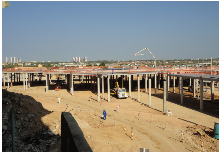
2ª ETAPA - Vista da área correspondente ao Estacionamento Coberto 2