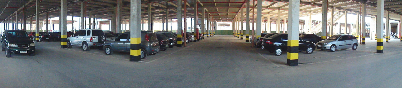
Vista do estacionamento coberto 1 em uso. Não há sistema de drenagem superficial. Também não há licenciamento pelo Corpo de Bombeiros e Prefeitura de Fortaleza.