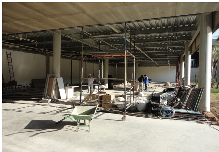
Área ainda em obras, correspondente ao refeitório da SESPORTE, que será utilizada para o setor administrativo / financeiro do DAE.