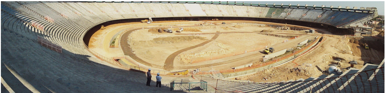
4ª ETAPA – Execução do rebaixamento do nível do terreno na área do campo.