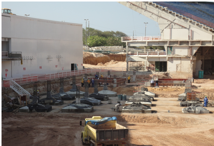
3ª ETAPA – Execução das fundações e terraplenagem do edifício Central.