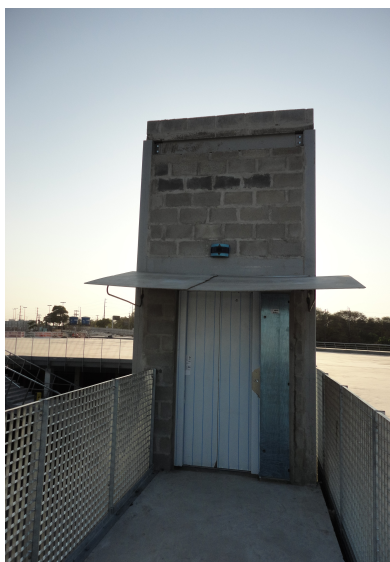
Fosso do elevador de acesso à praça do estádio ainda sem acabamento / revestimento e com elemento de cobertura provisório.