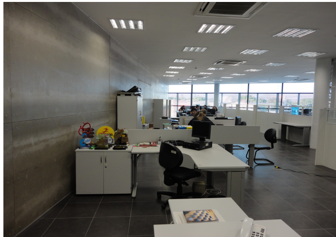
Área interna do prédio da SESPORTE com funcionários trabalhando, porém sem as devidas licenças / alvarás para funcionamento e utilização.