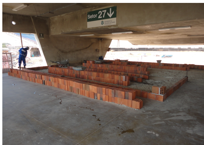
4ª ETAPA – Execução de alvenarias de banheiros no nível inferior de arquibancadas.