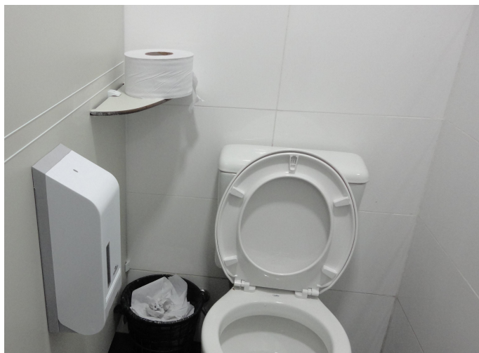
Papeleiras instaladas nos banheiros impróprias para uso com papel higiênico em rolos.