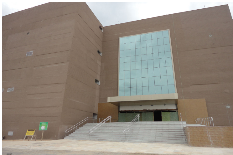
Figura 02 – Vista parcial da fachada oeste. Detalhe para as irregularidades na superfície das paredes externas.