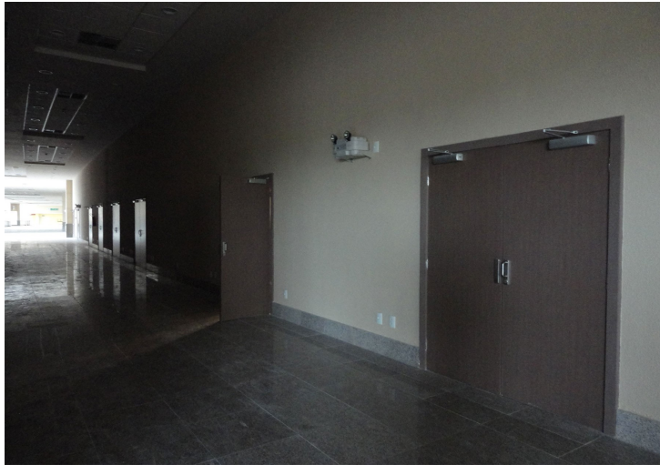
Figura 13 – Área correspondente ao 1º mezanino – salas para seminários e workshops .