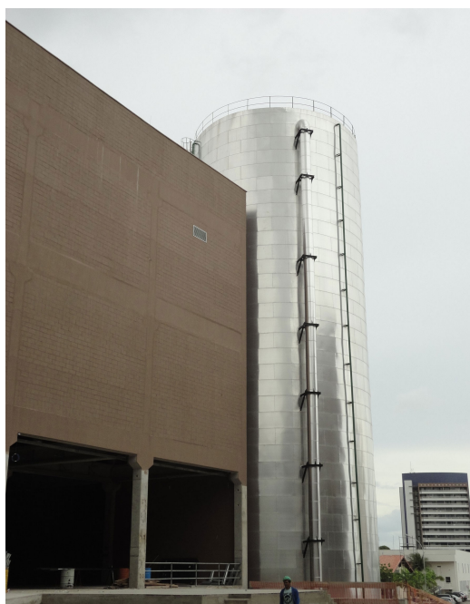
Figura 11 – Torre de água gelada – sistema de refrigeração do Centro de Eventos.