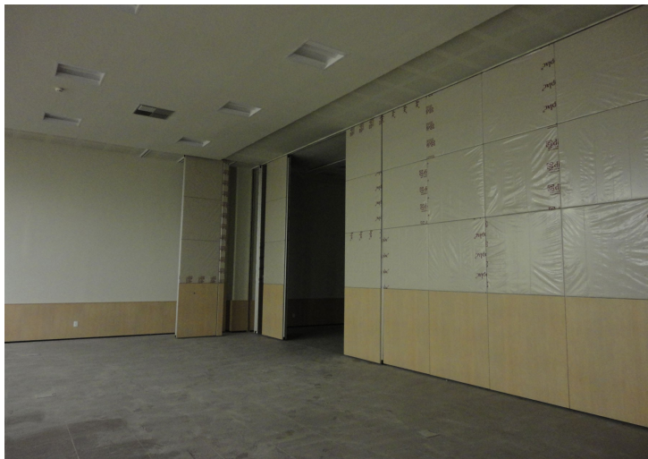
Figura 14 – Vista interna de uma sala para seminários. Detalhe da divisória retrátil.