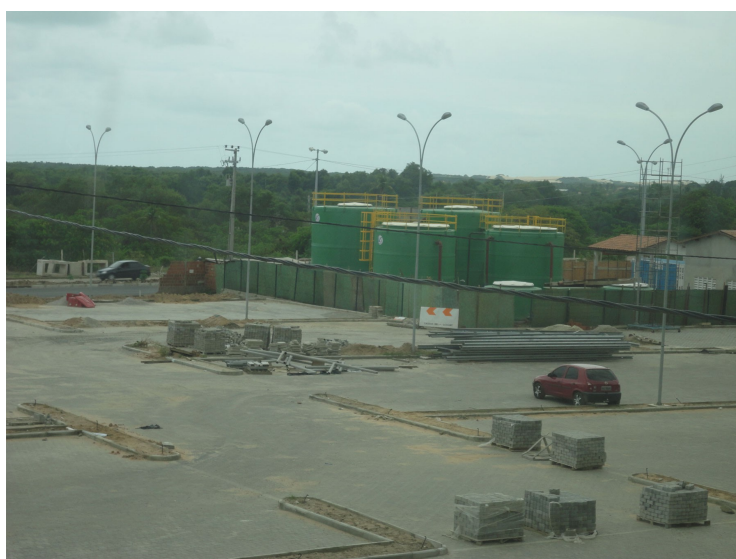
Figura 12 – Vista da Estação de Tratamento de Esgotos - ETE.