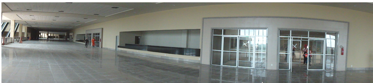
Figura 03 – Vista panorâmica do foyer térreo Área de circulação, balcão de credenciamento e acesso ao pavilhão de eventos.