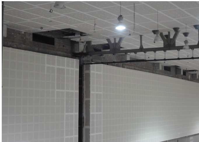
Figura 07 – Detalhe do trilho da divisória retrátil no Pavilhão de Eventos.