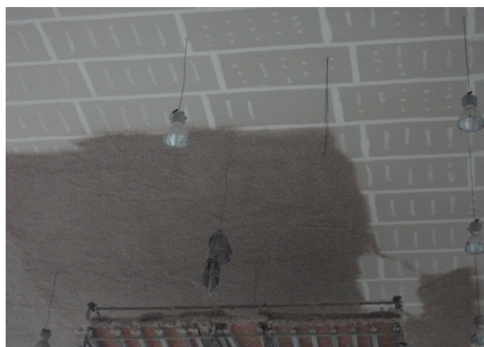
Figura 09 – Aplicação de revestimento acústico no forro do Pavilhão de Eventos.