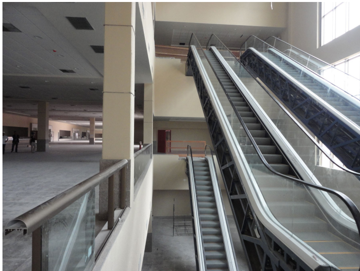
Figura 04 – Escadas rolantes de acesso aos mezaninos.