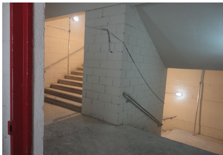
Figura 15 – Vista da escada de emergência – paredes sem acabamento.