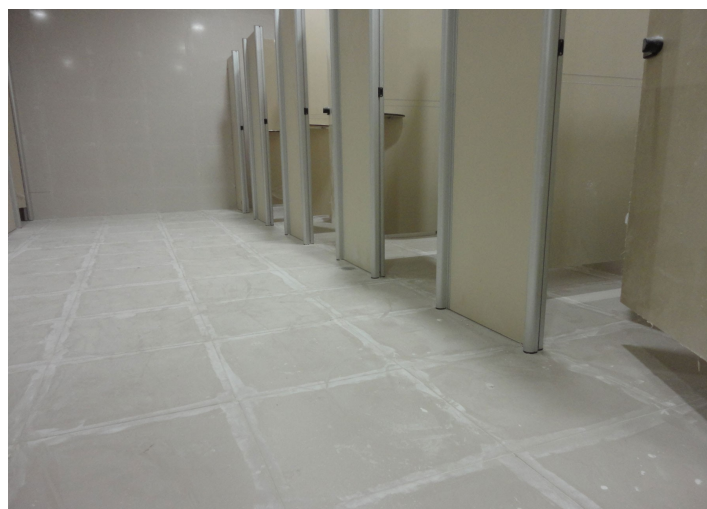
Figura 18 – Detalhe das divisórias dos compartimentos sanitários em contato com o piso.