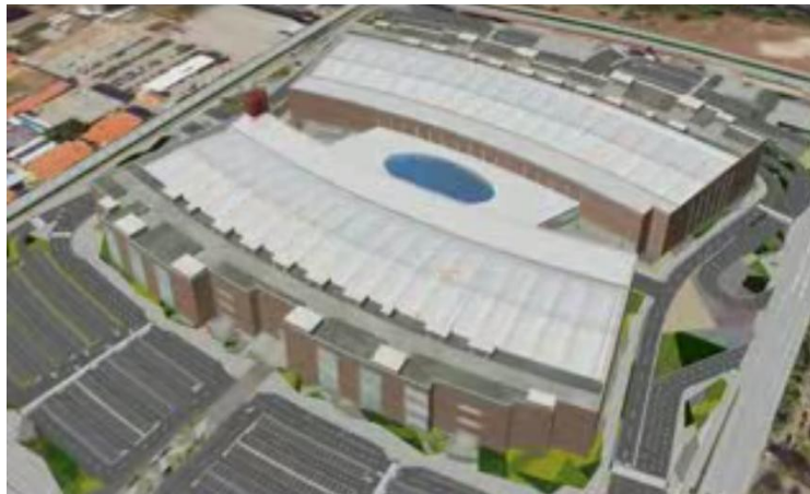
Figura 01 – Maquete eletrônica do Centro de Eventos.