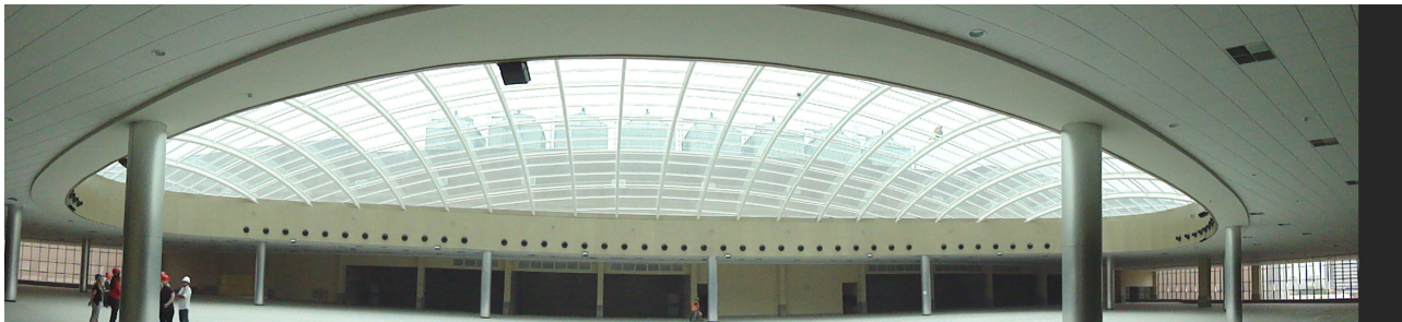
Figura 10 – Vista panorâmica da área de convivência, localizada no vão central do Pavilhão de Eventos. Detalhe da cúpula de vidro.