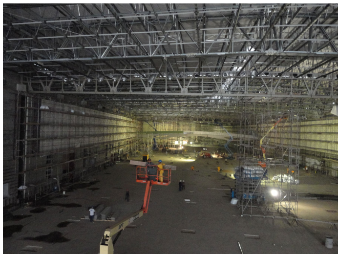
Figura 08 – Vista da 2ª área do Pavilhão de Eventos.