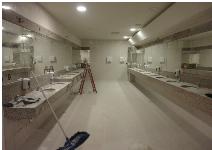
Figura 17 – Vista interna dos banheiros.