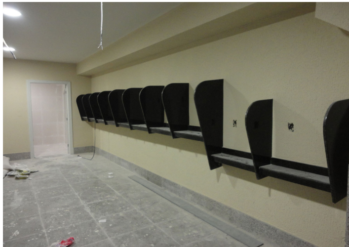
Figura 16 – Área de cabines telefônicas.