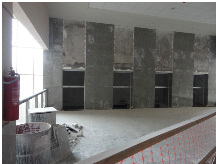
Figura 05 – Hall de elevadores.