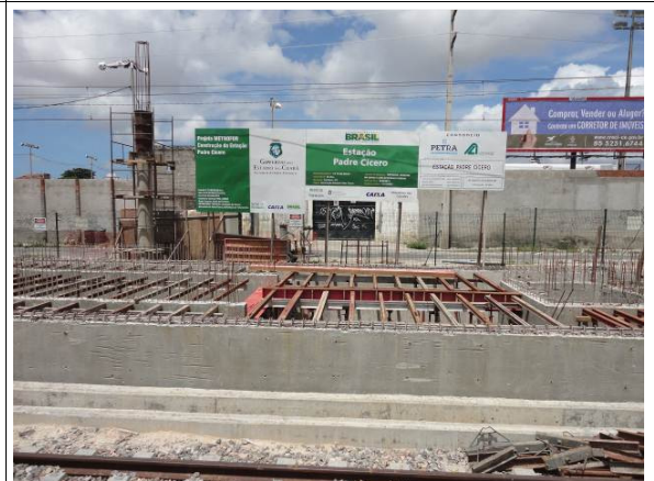
Foto 4 – Vista parcial do canteiro de obras da Estação Padre Cícero (estação em nível de superfície).