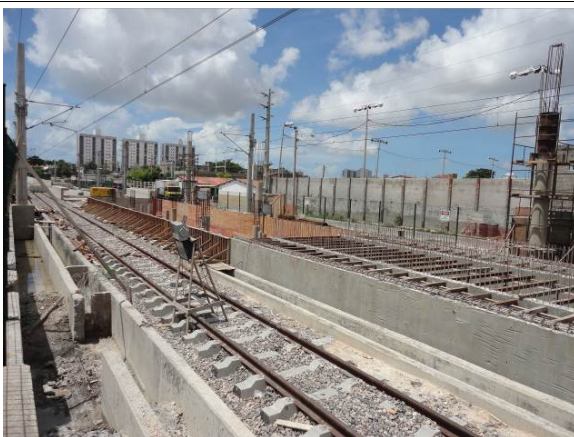
Foto 5 – Vista do canteiro da Estação Padre Cícero – sentido Centro de Fortaleza.