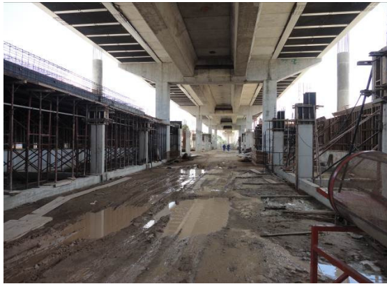
Foto 1 – vista interna do canteiro de obra da Estação Juscelino Kubitschek (estação em elevado).