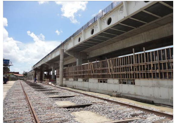
Foto 2 – Vista da lateral (externa) do canteiro da Estação Juscelino Kubitschek (estação em elevado).E