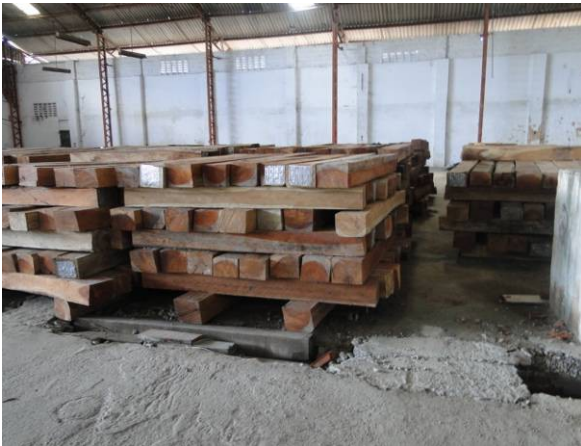
Foto 1 – Estocagem de dormentes para substituição dos existentes em galpão localizado no canteiro de obras do consórcio, no Bairro Vila União.