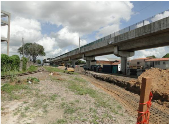
Foto 3 – Obra em andamento (movimento de terra, aterro e compactação) em área circunvizinha ao terminal de ônibus e a estação de metrô da Parangaba