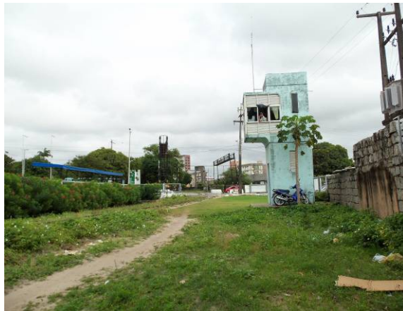
Foto 9 – Área liberada para execução de obras na proximidade da Av. Aguanambi, sem problemas de desapropriação.