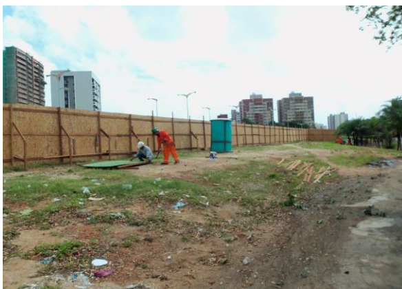
Foto 11 – Área isolada para início de execução de obras na proximidade da Via Expressa e Terminal do Papicu, com terreno sem pendência de desapropriação.