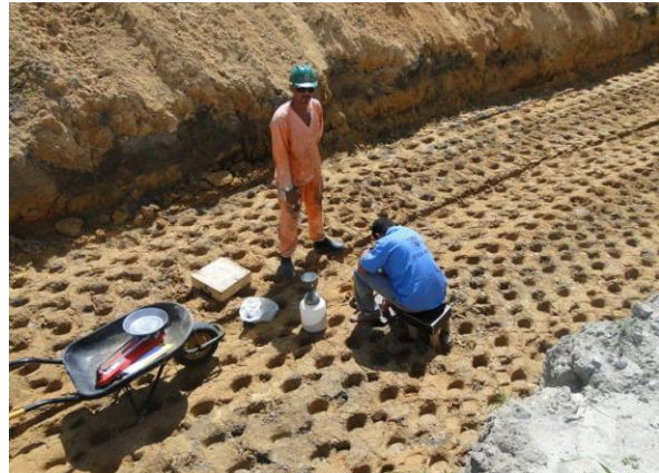
Foto 4 – Testes de densidade do solo “in situ” após compactação de solo efetuada em trecho próximo a estação de metrô da Parangaba.