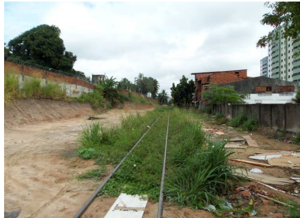
Foto 10 – Área isolada (tapume) para início da execução de obras na proximidade da Av. Aguanambi, em virtude de não existir pendência de desapropriação.