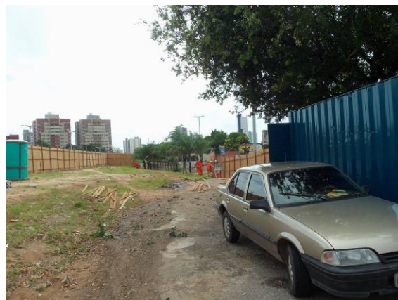
Foto 12 – Outra visão interior da área isolada na proximidade da Via Expressa e Terminal do Papicu.