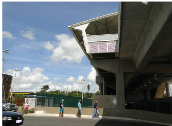
Foto 6– Local da estação do VLT Parangaba a ser construída interligando-se à estação de metrô existente (Linha Sul METROFOR) e estação rodoviária.