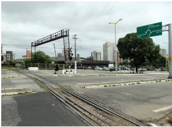
Foto 7 – Local de futura passagem elevada do VLT na Av. Aguanambi.