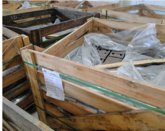
Foto 2 – Estocagem de placas de apoio PA-45 no galpão localizado no canteiro de obras do consórcio, no Bairro Vila União.