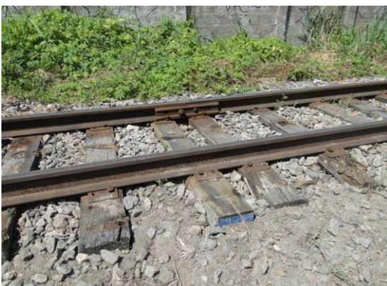
Foto 5– Trecho de linha de trem cujos dormentes serão substituídos