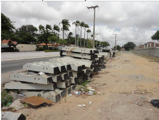
Foto 11 - Dormentes de concreto posto em obra paralisada.