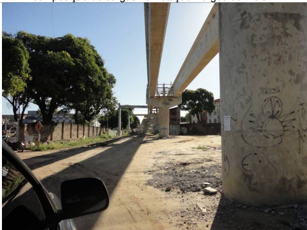
Foto 3 - Placas pré-moldadas em concreto que comporão a plataforma do Elevado da Parangaba.