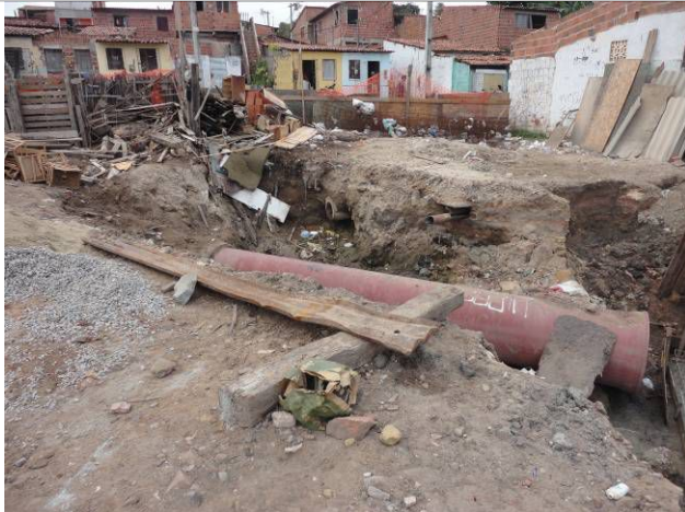
Foto 7 - Obra da CAGECE para remoção de interferência com a futura ponte ferroviária sobre Riacho Tauape.