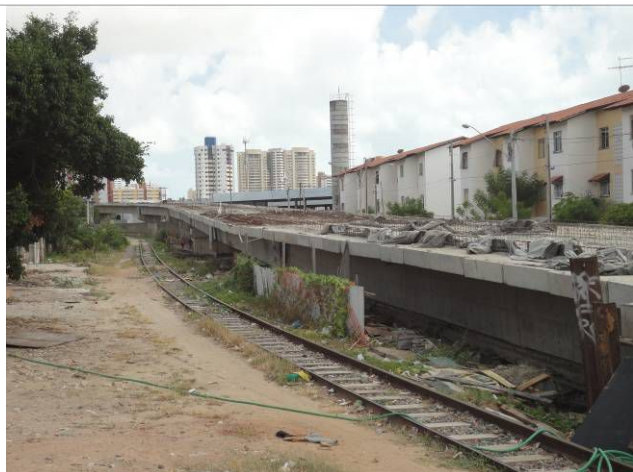
Foto 4 - Elevado da Aguanambi: transição do trecho em superfície e do trecho elevado.