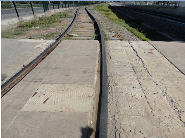
Foto 1 - Revestimento de piso já danificado pelo tráfego da composição de cargas na Estação Borges de Melo.