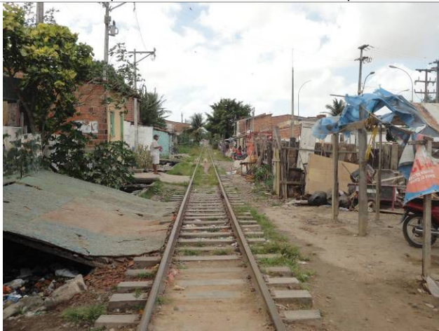
Foto 9 - Trecho com ocupação familiar no bairro São João do Tauape - sem intervenções construtivas.