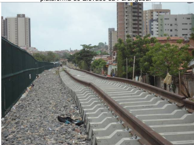
Foto 5 - Visão das linhas férreas com trilhos soltos, desnivelados, desalinhados, descontínuos, sem concordância nos planos vertical e/ou horizontal e sem fixação nos dormentes.