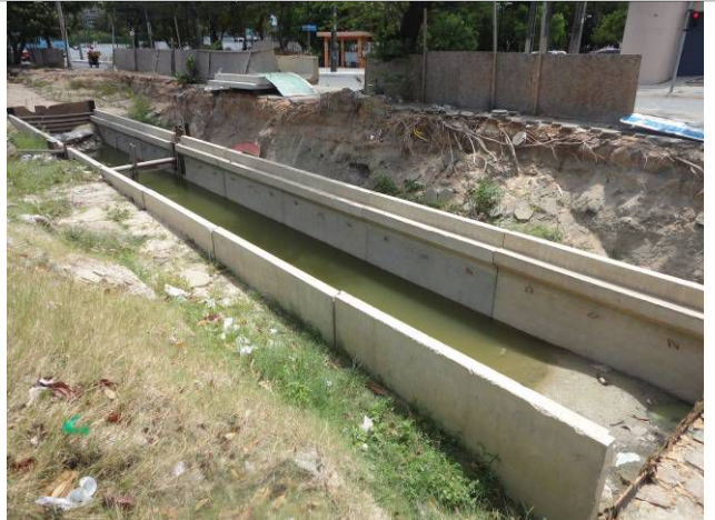
Foto 8 - Obra da galeria de drenagem na futura passagem inferior de veículos da Av. Borges de Melo.