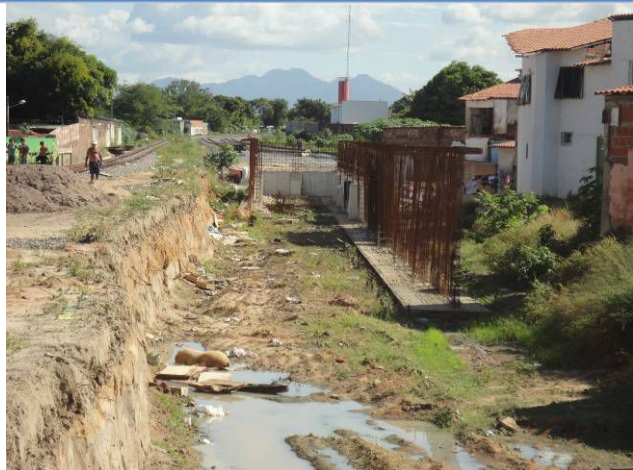
Foto 2 - Muro de arrimo inacabado.