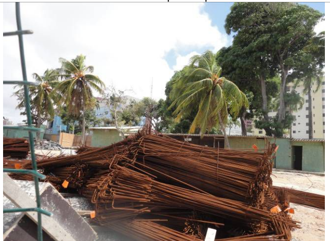
Foto 12 - Ferro posto em canteiros de obra desativado.