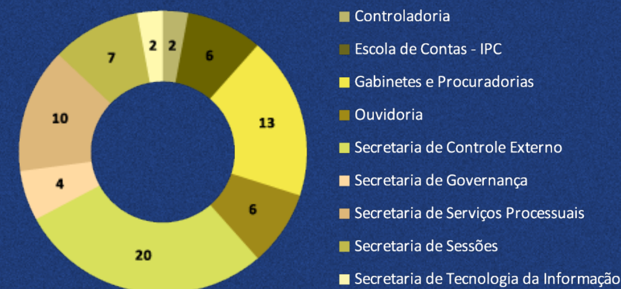
SUGESTÕES DE MELHORIA E PROPOSTAS DE IMPLEMENTAÇÃO