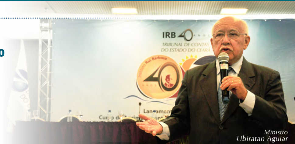
Ministro Ubiratan Aguiar