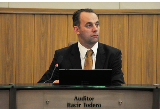
Auditor Itacir Toderó

“A Ouvidoria é um espaço institucional de participação cidadã e de controle social na gestão, voltada para a racionalização dos recursos públicos, a qualidade na prestação de serviços e a transparência no exercício do poder. Desta forma, a Ouvidoria do Tribunal de Contas do Estado do Ceará vem ao encontro dessa ansiedade e objetiva ser um instrumento de controle social e transparência.” A declaração é do conselheiro substituto Itacir Toderó, ouvidor do TCE-CE desde 22/7.