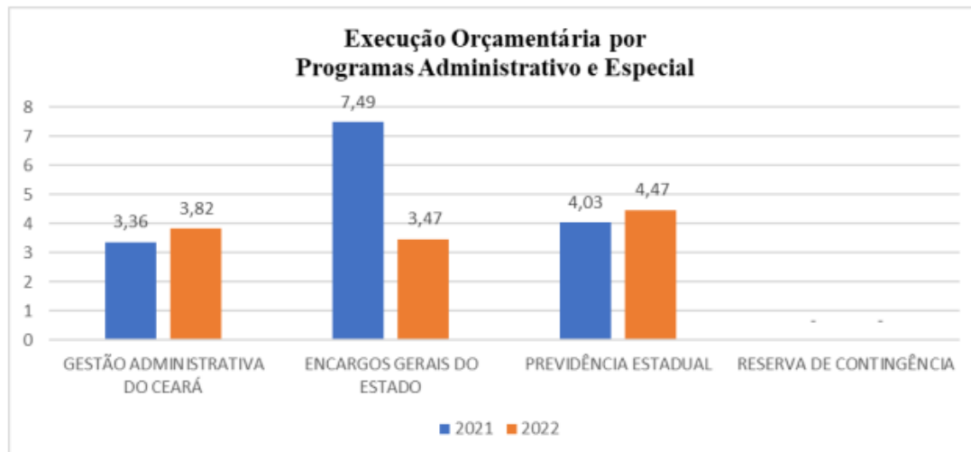
Gráfico 21 – Comparativo dos programas administrativo e especial em 2021(*) e 2022 (R$ bilhão)

Ainda com relação às despesas, é importante mencionar que a Unidade Técnica destacou que a maior despesa executada no contexto dos Programas Administrativos e Especial , foi no Programa 213 - Previdência Estadual , conforme fls. 26 do referido Relatório Técnico que está representado pelo gráfico a seguir: