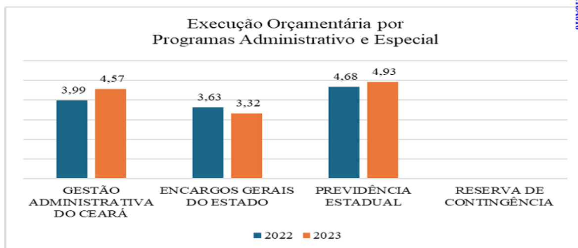
Gráfico 19 – Comparativo dos programas administrativo e especial em 2022(*) e 2023 (R$ bilhões)

Ainda com relação às despesas, é importante mencionar que a Unidade Técnica destacou que a maior despesa executada no contexto dos Programas Administrativos e Especial , foi no Programa 213 - Previdência Estadual , conforme fls. 29/30 do referido Relatório Técnico nos termos a seguir: